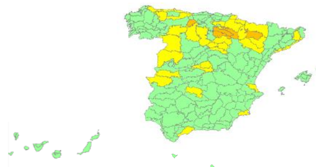
Nivel de alerta por provincias y zonas isoclimáticas

Probabilidad de exceso de mortalidad atribuible a temperatura (índice Kairós)