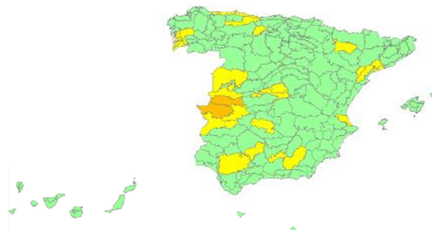
Nivel de alerta por provincias y zonas isoclimáticas