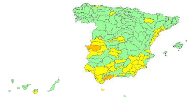
Nivel de alerta por provincias y zonas isoclimáticas