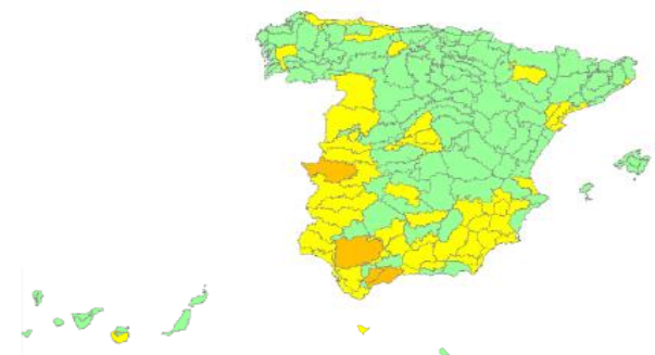
Nivel de alerta por provincias y zonas isoclimáticas