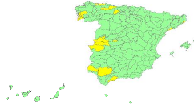
Nivel de alerta por provincias y zonas isoclimáticas