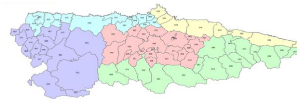
Distribución de las zonas isoclimáticas de Asturias

Predicción de AEMET a día de hoy. Comunicada por Ministerio de Sanidad.