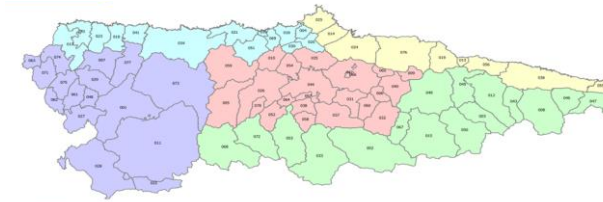
Distribución de las zonas isoclimáticas de Asturias

Predicción de AEMET a día de hoy. Comunicada por Ministerio de Sanidad.