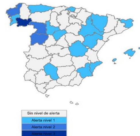
Nivel de alerta por provincias